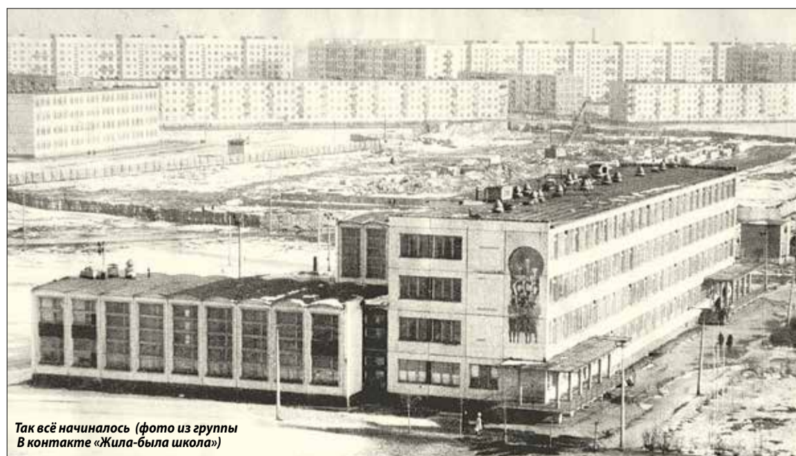
Так всё начиналось