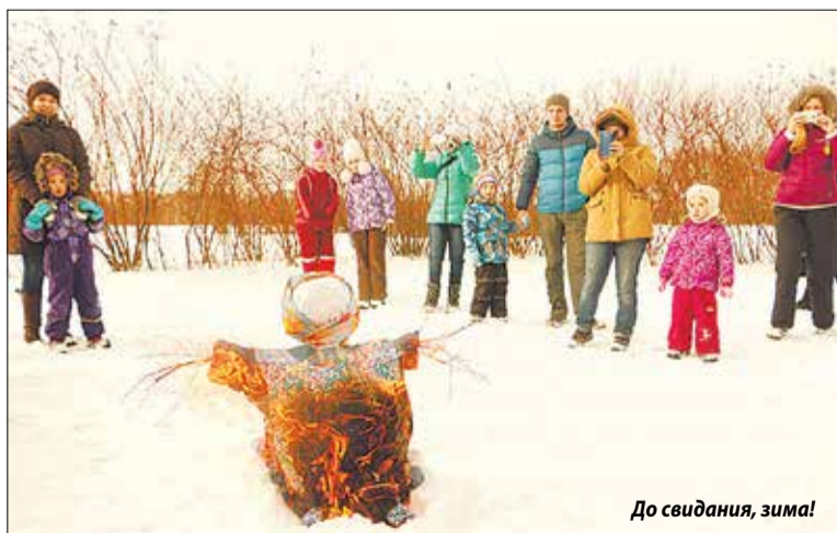
До свидания, зима!