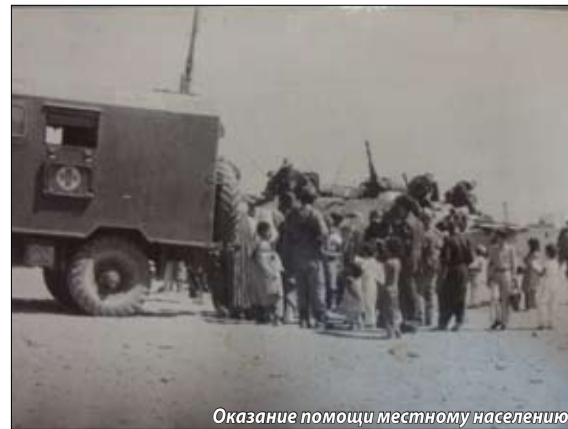
Оказание помощи местному населению