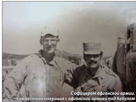
С офицером афганской армии. Совместная операция с афганской армией под Кабулом