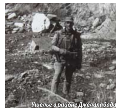
Ущелье в районе Джелалабада